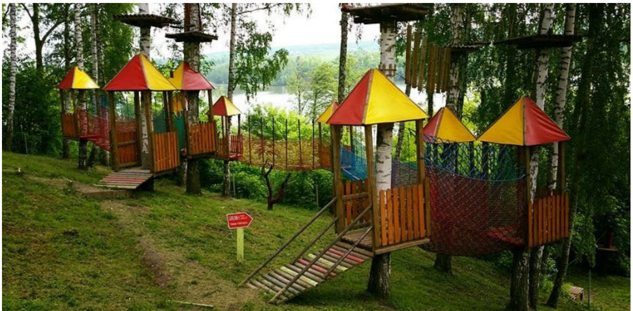
Park Linowy Górzno

Ścieżka z linami – ścieżka jest utworzona z okrągłaków na linach stalowych będących oparciem dla nóg, zaś z góry zwisa kilka pętli pomocniczych – lian – będących oparciem dla rąk. 1