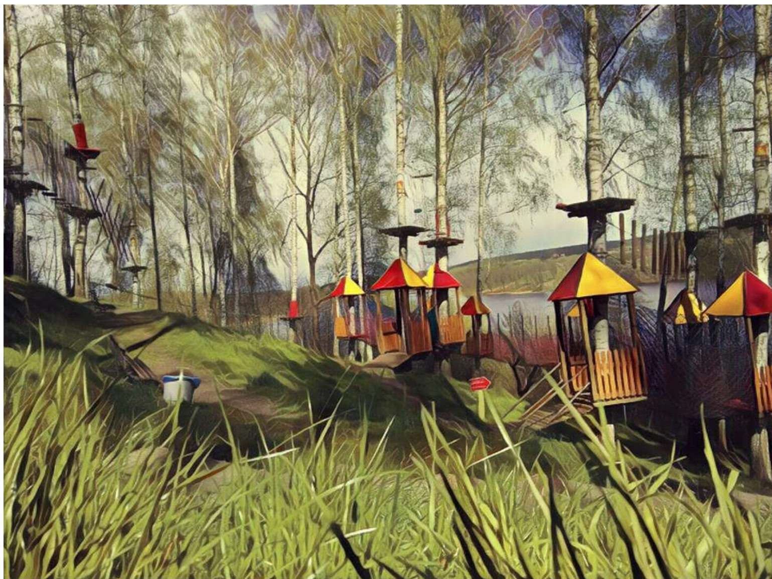
Park Linowy Górzno

Przeszkody linowe stanowią najróżniejsze konstrukcje z lin, siatek i elementów drewnianych. Przeszkody przeznaczone są do przewyciężenia za pomocą przyporządkowanych elementów, do ewentualnego zatrzymania upadku służą siatki ochronne zainstalowane po stronach przeszkody oraz pod nią. Siatki asekuracyjne nie są przeznaczone na pierwszym miejscu do przepiężania, w przeciwnym razie istnieje ryzyko ich szybkiego przetarcia. Dolna część niektórych przeszkód wykonana jest z drewnianych desek lub stabilnej planki samochodowej – w takich przypadkach dolna część nadaje się do chodzenia. 1