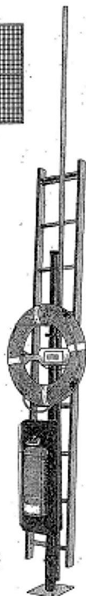
Ryc. 9. Przykładowe wyposażenie pomostu i stanowiska ratowniczego

(podstawa, słup, drabina, bosak, koło ratunkowe, rzutka, gaśnica)