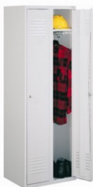
Szafa ubraniowa SUM 320